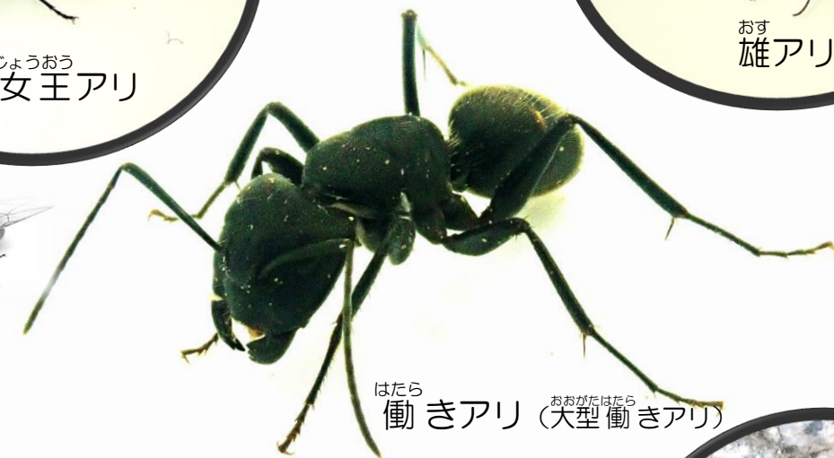
働きアリ (大型働きアリ)