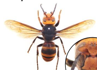
コガタスズメバチ Vespa analis