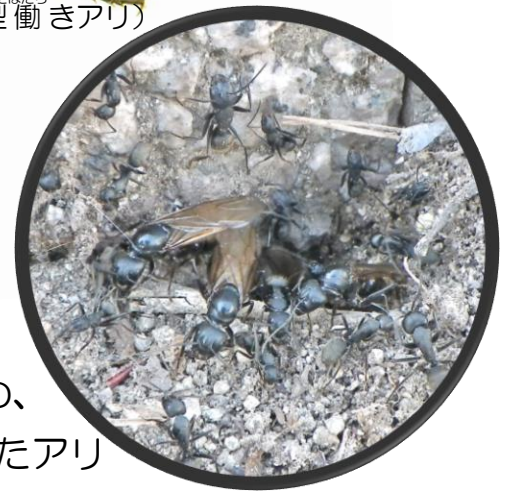
結婚飛行のため、巣の入口へ集まったアリ

クロオオアリはムネアカオオアリなどと並んで、日本で最大級のアリの一つです。開けた明るい環境を好むため校庭や公園にも営巣し、日常的に目にする機会も多いです。本種は春から初夏にかけて結婚飛行を行ないます。晴れた日の夕方、巣から多数の新女王アリと雄アリが飛び立ち、互いに他の巣から飛び立った相手と交尾します。女王アリは結婚飛行を終えると、地上へ降りて翅を落とし、新しい巣を作ります。巣穴を作る場所を探している女王アリは見つけやすく、飼育も比較的簡単なので、アリの中では飼育の入門におすすです。(逸見)