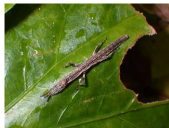
コブナナフシ 1齢幼虫 (×1.5倍)