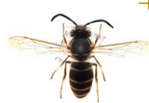
クロスズメバチ Vespula flaviceps