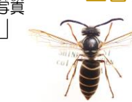
シダクロスズメバチ Vespula shidai