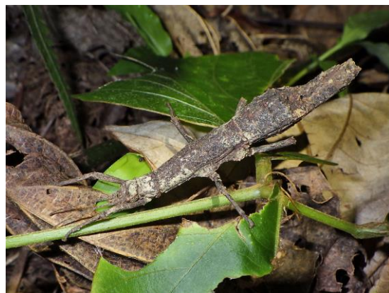
コブナナフシ 成虫(メス) ▲ 実物大

こんちゅう館では、コブナナフシの卵、幼虫、成虫を1つのケースに同居させ、展示個体の出し入れをせずに2年近く展示を維持しています。