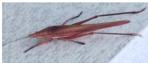
◀ 壁についていた “ピンク色”のクビキリギス

野外で見かけるクビキリギスのほとんどは緑色や 茶色ですが、まれに“ピンク色”の個体を見かけます。 “ピンク色”の個体はバッタやキリギリスのいくつか の種で見つっていますが、日本で一番“ピンク色”の 個体が見つかる種は、なんとクビキリギスです。 よく探してみると、皆さんも“ピンク色”のクビキリ ギスに出会えるかもしれません。