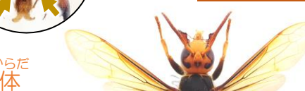
ヒメスズメバチ Vespa ducalis