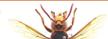
モンズメバチ Vespa crabro