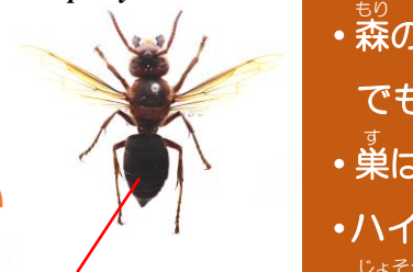
チャイロスズメバチ Vespa dybowskii