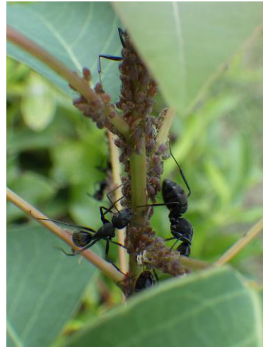
※写真：クロオオアリとアブラムシ