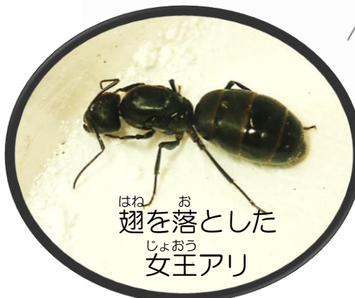
翅を落とした女王アリ