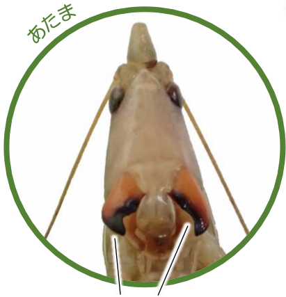
オレンジ色の大あご