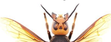
オオスズメバチ Vespa mandarinia