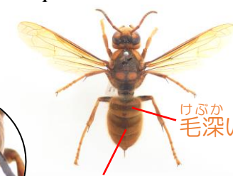
キロスズメバチ Vespa simillima