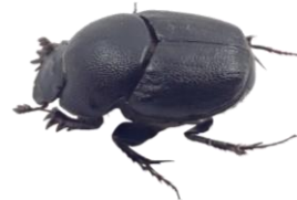
クロマルエンマコガネ(メス)