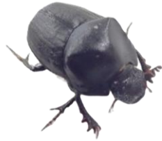
クロマルエンマコガネ(オス)