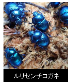
ルリセンチコガネ

押し虫の中でもオオセンチコガネは色彩変異が多く、紫色や緑色の他、奈良県などでは「ルリセンチコガネ」と呼ばれる綺麗な青色の個体があります。角や突起があるかっこいい押し虫もいます。特にツノコガネのオスには体の半分以上の長さがある立派な角があります。