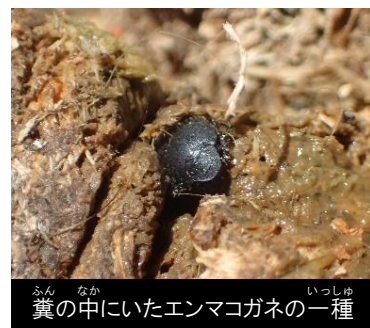
糞の中にいたエンマコガネの一種

押し虫の生態は「糞を転がして糞球を作るタイプ」、「トンネルを掘って糞を運びこむタイプ」、「糞にもぐりこむタイプ」の大きく3つに分けられます。こんちゅう館の周りで見かけるセンチコガネやゴホンダイコクコガネは「トンネルを掘るタイプ」、マグソコガネやエンマコガネの仲間は「もぐりこむタイプ」です。