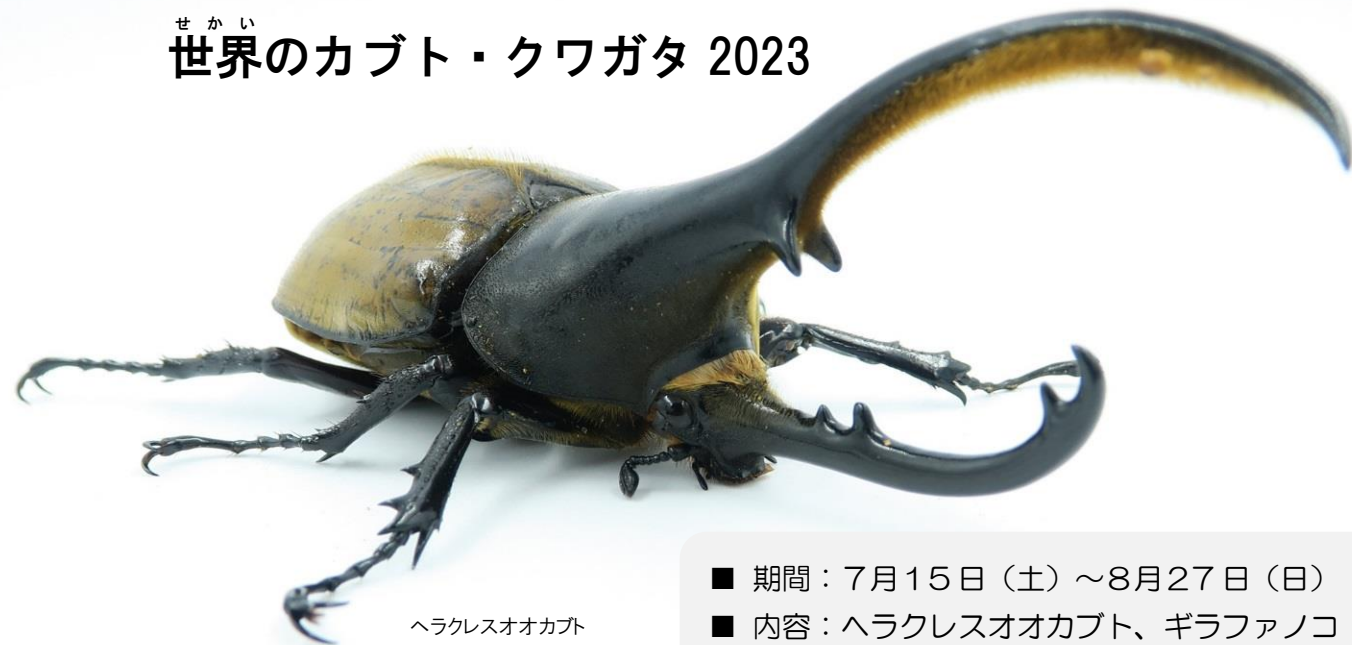
ヘラクレスオオカブト